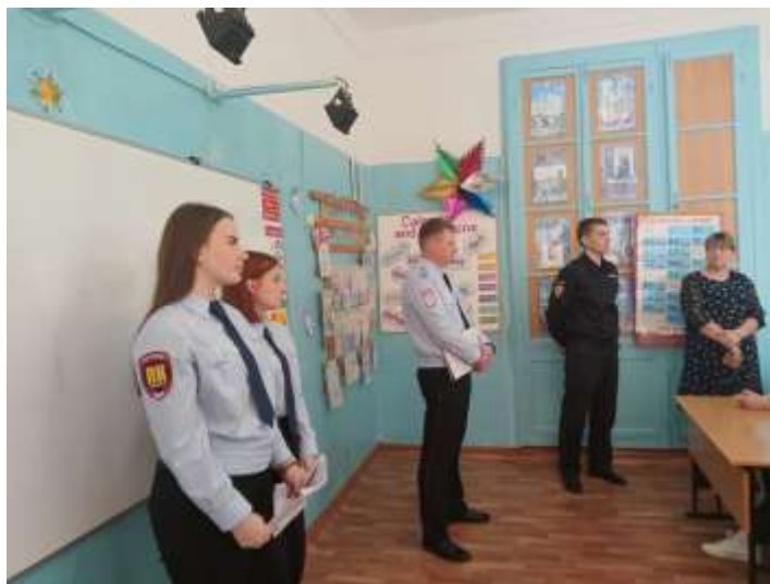
Профилактическое мероприятие «Права и обязанности подростков в современном мире» в Ивановской и Ингольской школах Шарыповского муниципального округа.