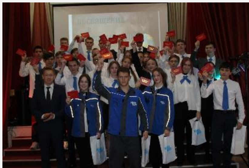
Публичный доклад МАОУ СОШ №8 г.Шарыпово за 2022-2023 учебный год